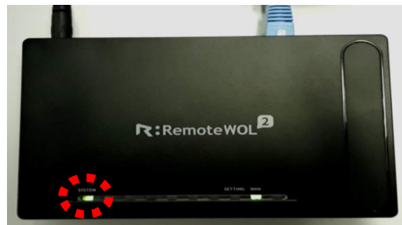
図1 SYSTEM ランプが点灯されているか確認(RemoteWOL 前面)